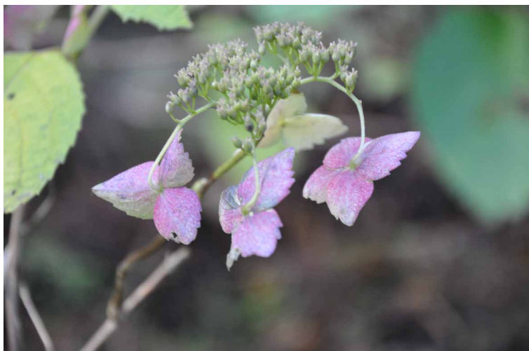
▲ 夏の名残の山あじさい