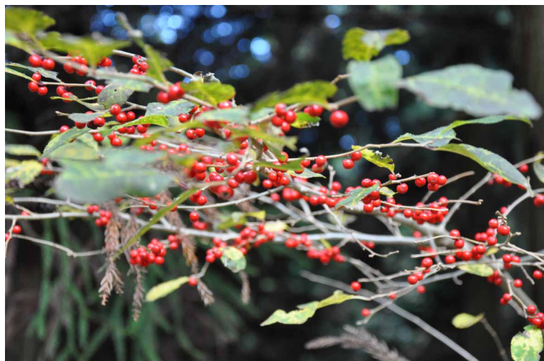
▲ 実りの時を迎えた木々